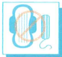
FEMININE HYGIENE PRODUCTS