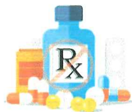
MEDICATIONS & SUPPLEMENTS