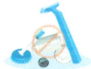
METALS & PLASTICS