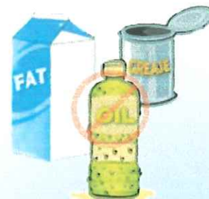
FATS, OILS & GREASE